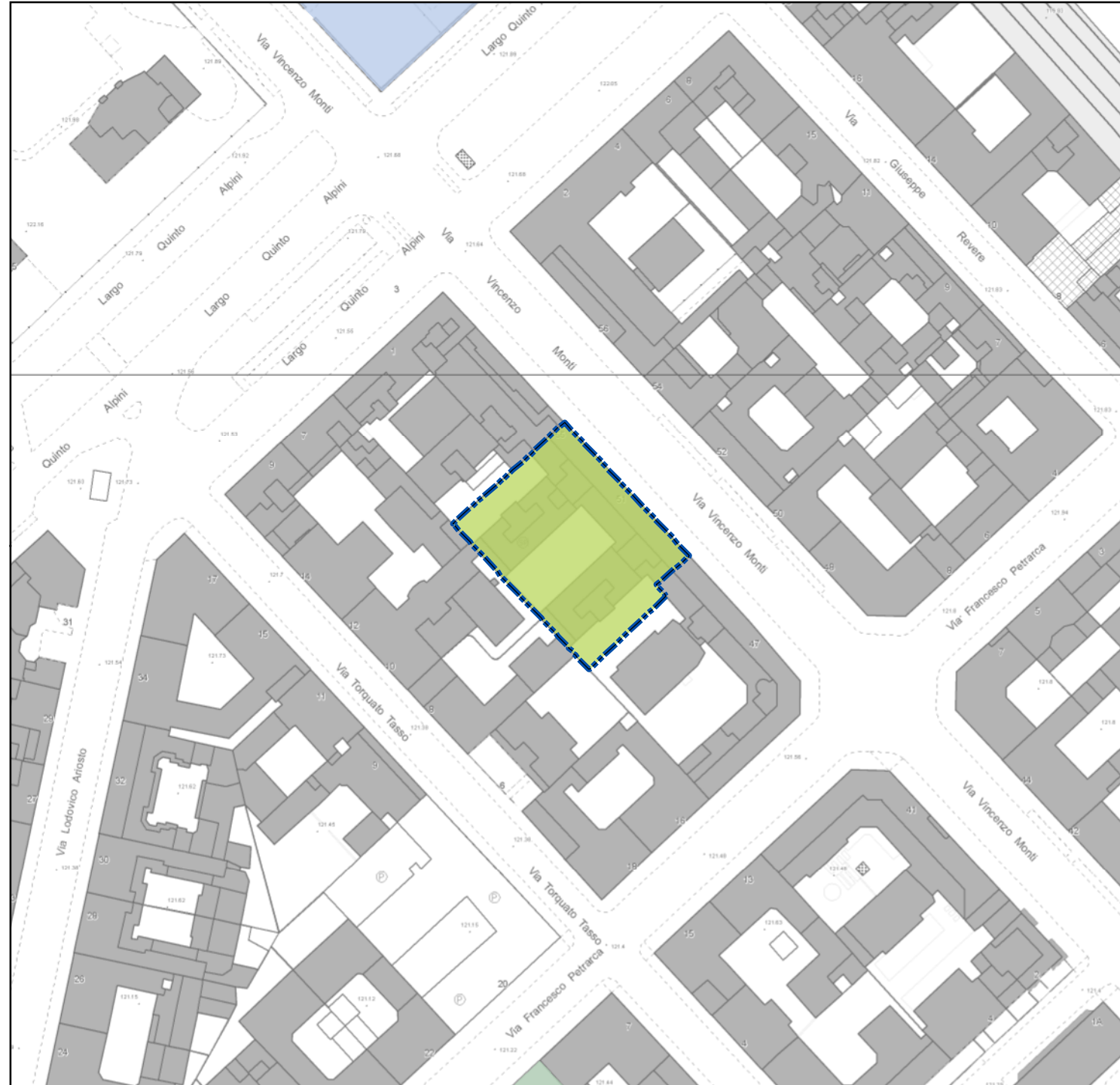
Stralcio della TAV S.01 | I Servizi Pubblici e di interesse pubblico o generale - PGT VIGENTE