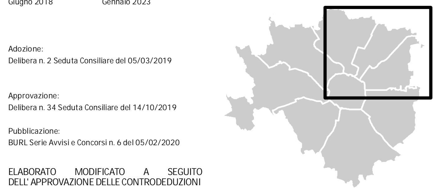
Quadrante: 2_Nord Est Scala: 1:10.000